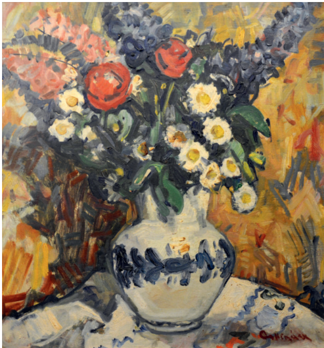
Poľné kvety, 1961, olej, preglejka, 50 x 45 cm