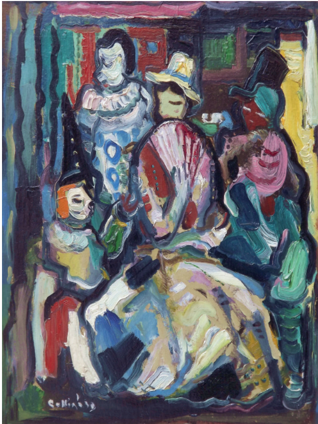
Rodina klauna, 1947, olej, kartón, 25 x 19 cm